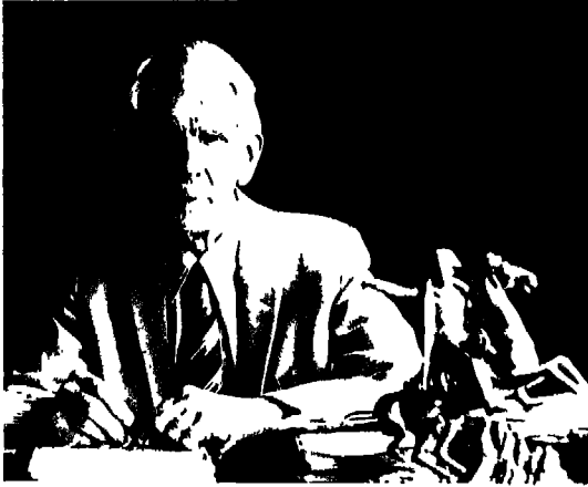
الدكتور فورشوفود الذي أثبت تسميم نابليون